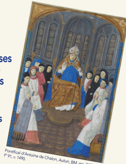
Pontifical d'Antoine de Chalon, Autun, BM, ms. S151(129), F° 91, v. 1490.

Stratégies politiques, enjeux, confrontations