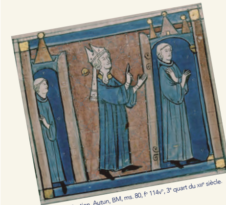
Décret de Gratien, Autun, BM, ms. 80, f° 114v, 3 e quart du xiv e siècle.

10-12 mai 2017 Université Grenoble Alpes